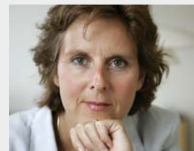
Connie Hedegaard, klima- og energiminister

Over de seneste år har vi i Danmark afsat historisk mange penge til udviklings- og demonstrationsprojekter, herunder storskala projekter. Til et lukket væksthussystem med opsamling af overskudsvarme mener jeg for eksempel det ny EUDP-pro-