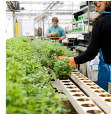
Krydderurter fra Legro A/S, Karlslunde